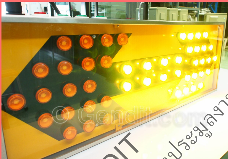
ป้ายไฟเตือนให้เบี่ยงเบนลูกศรสองทาง